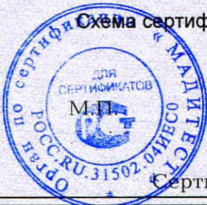
Схема сертификации 2.

Протокола проверки результатов услуг № 250014 от 13.01.2024