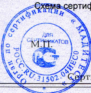
Схема сертификации 2.

Протокола проверки результатов услуг № 250017 от 13.01.2025