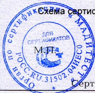
Схема сертификации 2.

Протокола проверки результатов услуг № 250020 от 13.01.2025