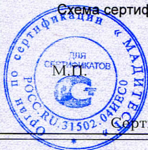
Схема сертификации 2.

Протокола проверки результатов услуг № 250015 от 13.01.2025