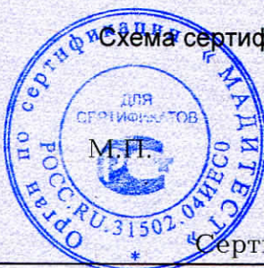
Схема сертификации 2.

Протокола проверки результатов услуг № 250021 от 13.01.2025