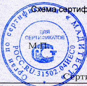
Схема сертификации 2.

Протокола проверки результатов услуг № 250012 от 13.01.2025